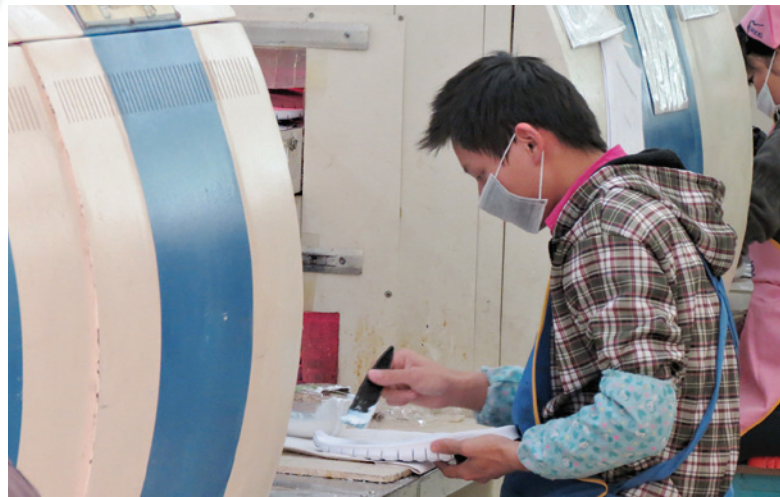
Oinetakoen ekoizpenaren langileen osasun eta segurtasun arazo gehienak, babesik gabe produktu kimiko toxikoak manipulatzeko ematen dira.

lan egindako sei urteren truke batz besteko soldatan oinarritutako kuota ordaintzeko konpromisoa hartzeko. Konpainiak etzituen eskaera guztiak onartu baina langileria nahikoak iruditu zitzaizkion.