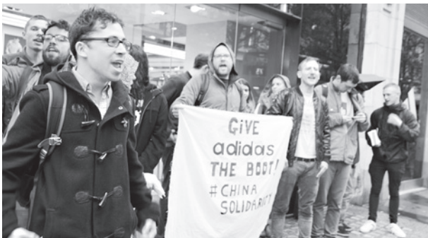
Txinako langileen grebarekiko elkartzuna adierazteko kontzentrazioa.

Lideko 13 langile elkarrizketatu genituen (10 emakume eta 3 gizon). Berrira filtraketa batengatik jaso zuten eta ez modu ofizialean. Langileek greba batekin erantzun zuten 2014ko abendutik 2015eko apirila arte. Zentzuzko kalte-ordainketak eskatzen zituzten. Grebak kobertura mediatiko handia izan zuen eta arrakastatzen hartu zen. Lide kalte-ordainak emateko konpromisoa hartu zuen baina gutxien ordaintzen saiatu zen. Hasieran enpresak 68 euro lan urte bakoitzarengatik ordaintzen saiatu zen baina lan egindako 5 urteren truke gehienez. Greba berri baterako deialdia egitea beharrezkoa izan zen Lidek